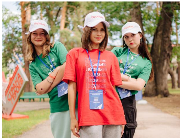
Региональная профильная смена “Время Первых”