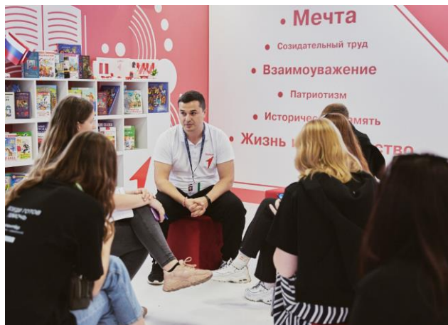
Медиафорум “ШУМ”, г.Калининград