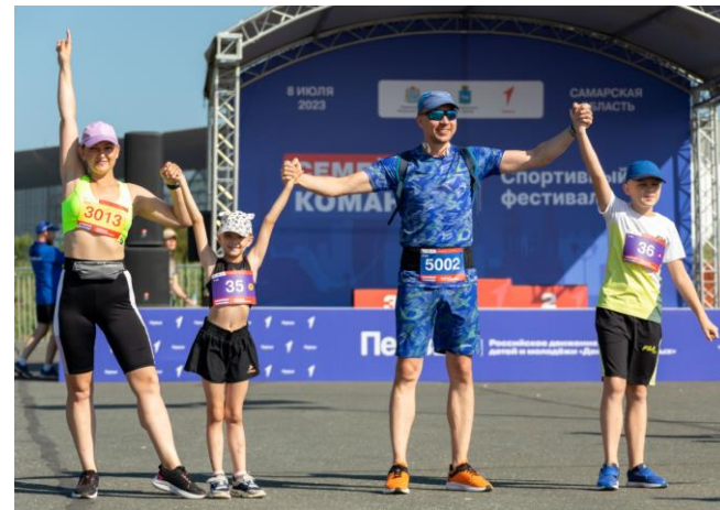
Спортивный фестиваль “Семейная команда”