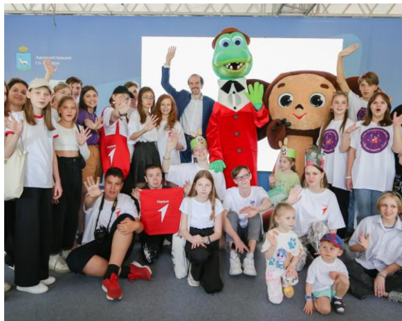
Форум детских инициатив “Тебе решать!”