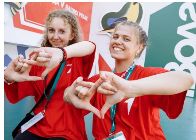
Молодежный форум iВолга, Самарская область