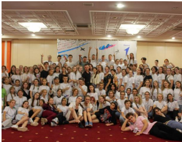
Литературный марафон, Орловская область